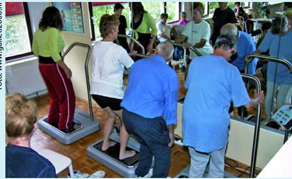
Abb. 3 Vibrationstraining nach dem Wipp-Prinzip dient zur Sturzprophylaxe bei älteren Menschen.

Dreiergruppen tun. So kann man die Kosten für die Patienten verringern. Meistens ist nach drei bis vier Trainingseinheiten keine Begleitung mehr notwendig, und die Patienten können das Training sicher selbstständig ausführen. Dann entfällt auch die Eingewöhnungsphase im Sitzen.